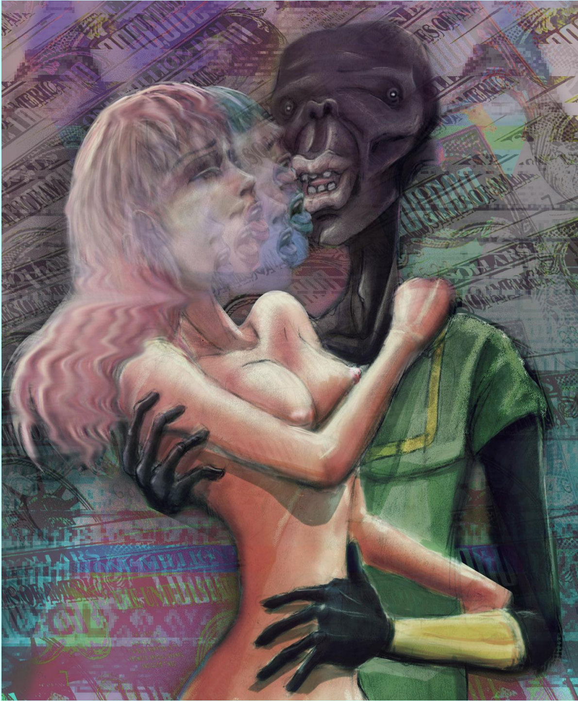
The beauty of Money