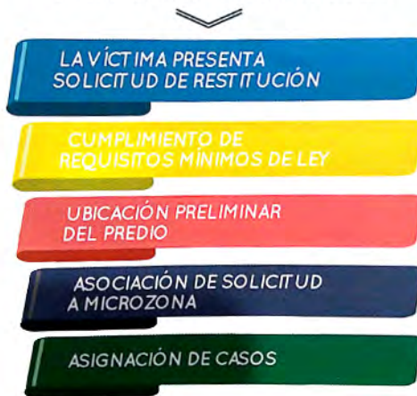
Diagrama 1 Procedimiento administrativo. Tomado de la Unidad Administrativa Especial de Gestión de Restitución de Tierras Despojadas, 2018.

En cuanto al ámbito judicial se hace un seguimiento a la solicitud de restitución a través del cumplimiento de los requisitos legales de naturaleza especial y general, el acervo probatorio y la participación en actuaciones y diligencias judiciales en materia de restitución (Unidad Administrativa Especial de Gestión de Restitución de Tierras Despojadas, 2018). Cabe destacar que en esta etapa los solicitantes cumplen con una carga probatoria mínima, no cabe duda de que estamos ante un procedimiento especial en el que las presunciones están a favor de la víctima.